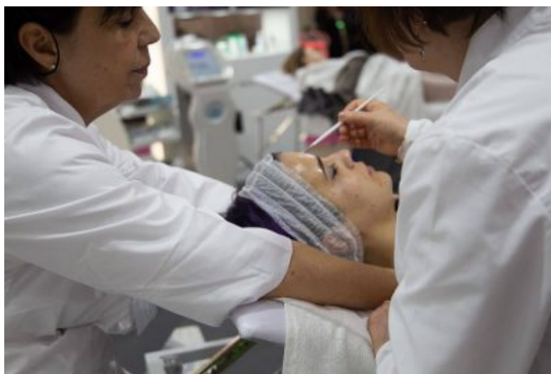
foto Roma International Estetica

Roma International Estetica XVI edizione – La bellezza è in continua evoluzione e i professionisti del settore non possono restare indietro.