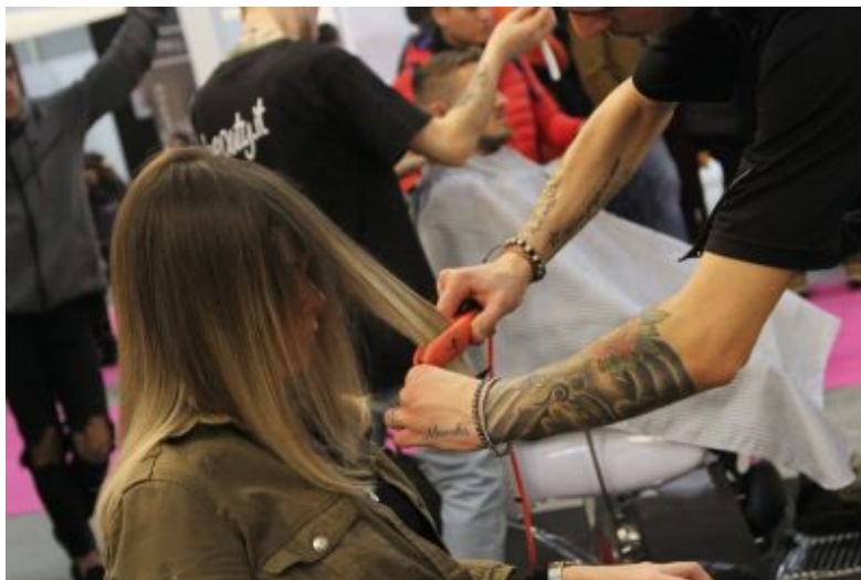
foto Roma International Estetica

Lezioni&demo live, contest&show – A RIE non manca certo l'area make-up e acconciature dove, in tutti e tre i giorni di manifestazione, sarà possibile partecipare a lezioni gratuite e demo live.