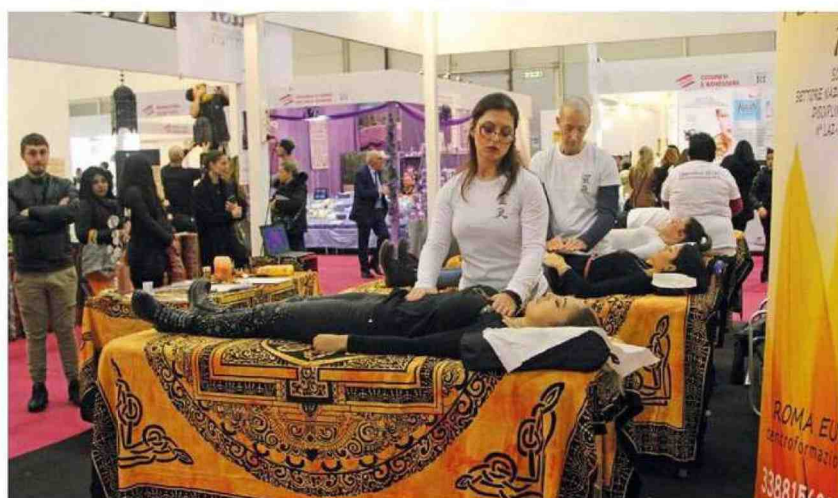
Accanto e sotto, tre momenti della scorsa edizione della fiera "RIE - Roma International Estetica"